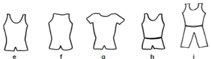
樣例 E 到 I 前後開口處相仿